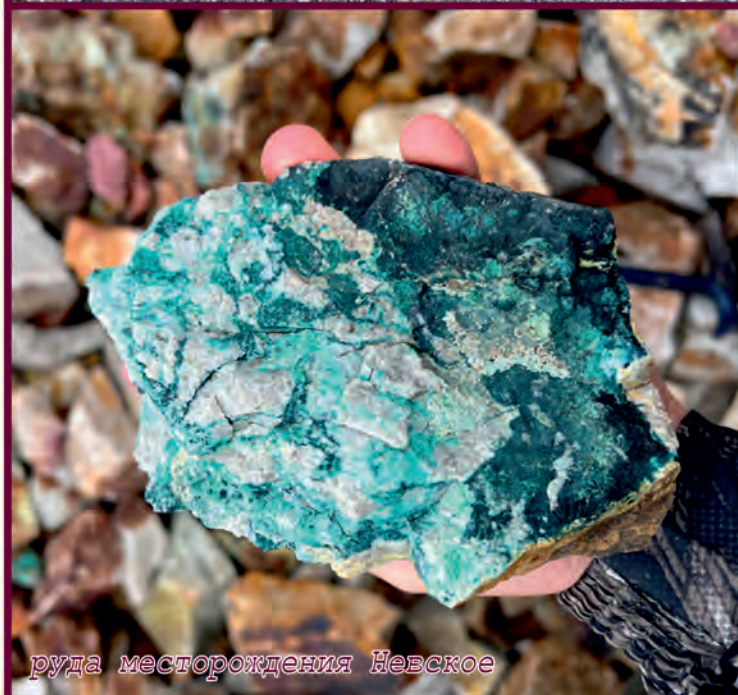
руда месторождения Невское