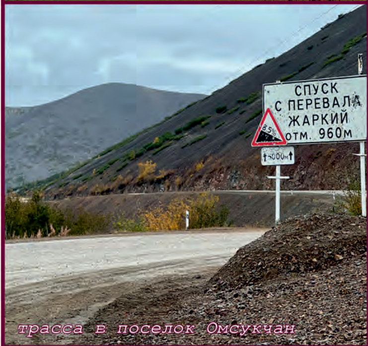
трасса в поселок Омсукчан