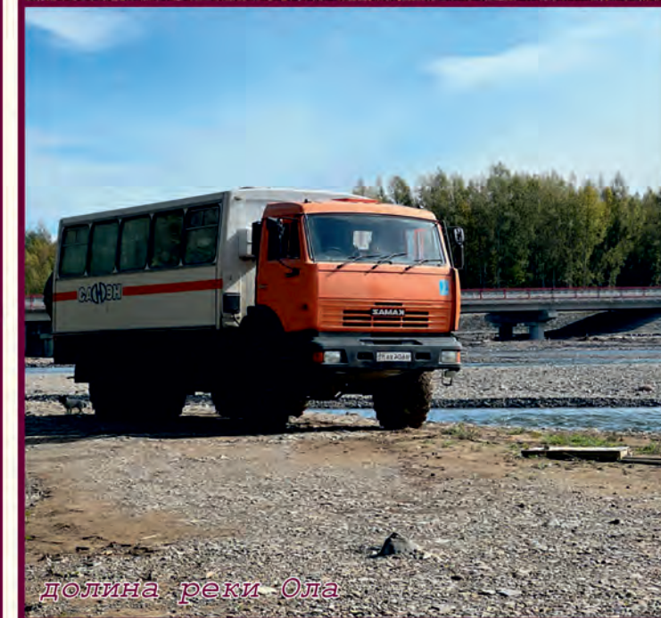
долина реки Ола