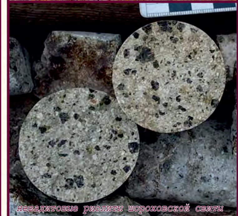
невадитовые риолиты шороховской свиты