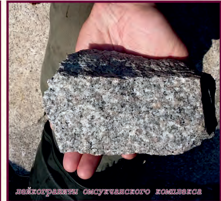
лейкограниты омсукчанского комплекса