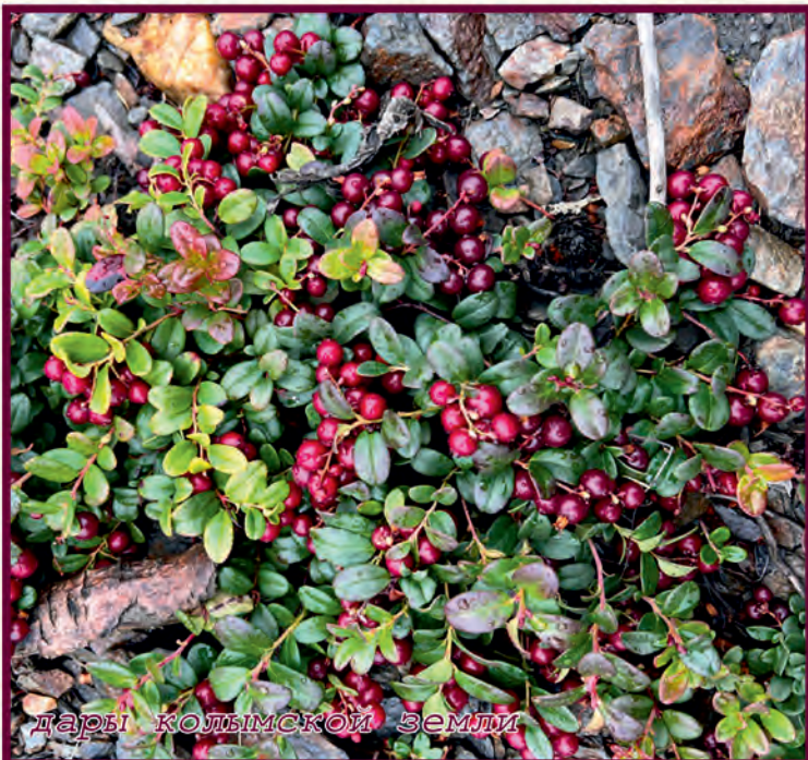
дары колымской земли