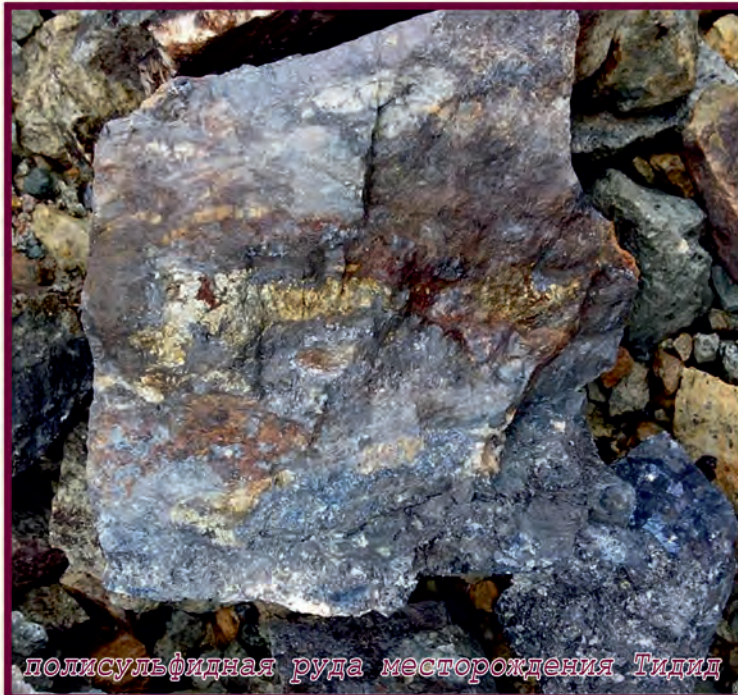
полисульфидная руда месторождения Тидид