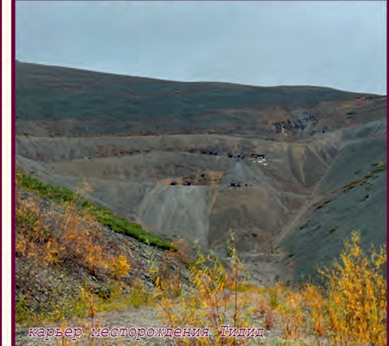
карьер месторождения Тидид