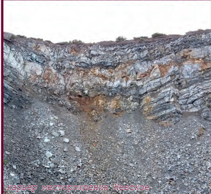
карьер месторождения Невское